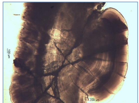
Photo au microscope (grossissement x40) d'un otolithe saumon atlantique (LCABIE, 2014)

L'outil privilégié sera la microchimie des otolithes . L'otolithe est une concrétion calcaire (voir photo ci-contre) située dans l'oreille interne qui enregistre la vie du poisson sous forme de stries de croissance journalière (longueur d'un otolithe de saumon : environ 5mm). Les otolithes seront prélevés sur les géniteurs (saumons et aloses) collectés morts post-reproduction, ou lors de la montaison sur des captures de pêcheurs professionnels ou amateurs. Les analyses des otolithes seront effectuées par ablation laser avec détection par spectrométrie de masse.