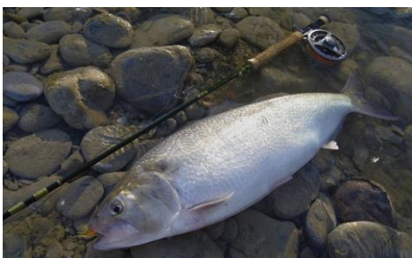
Grande alose pêchée à la ligne (C.LECOQ)